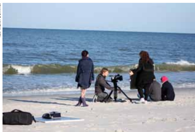
Zdjęcie z V. Edycji Plenerów Film Spring Open 2009