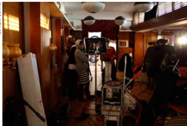
Zdjęcie z V. Edycji Plenerów Film Spring Open 2009