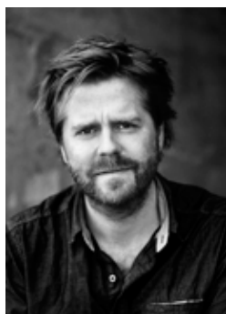
Janus Metz reż. filmu BAZA ARMADILLO (Armadillo)

3-godzinny masterclass uzupełnią pokazy wszystkich trzech części sagi, prezentowanych razem po raz pierwszy w Polsce w ramach mini-retrospektywy „3 x Helmerich”.