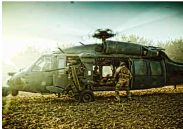
"Baza Armadillo" (Armadillo) Janus Metz