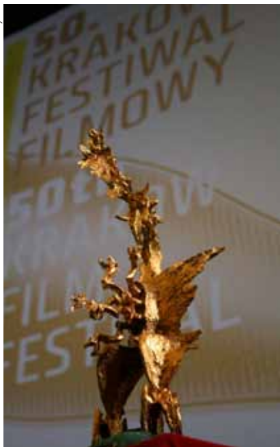
Nagroda Smok Smoków

Krakowski Festiwal Filmowy co rok przyznaje także nagrodę specjalną, za całokształt twórczości w dziedzinie filmu dokumentalnego i krótkometrażowego, zwana Nagrodą Smoka Smoków. W poprzednich edycjach jej laureatami byli m.in. Werner Herzog, Stephen i Timothy Quay oraz Jonas Mekas. Nazwisko twórcy, który w tym roku otrzyma Nagrodę Smoka Smoków zostanie ogłoszone w marcu. Tradycyjnie w programie festiwalu znajdzie się specjalny cykl prezentujący twórczość tego autora.