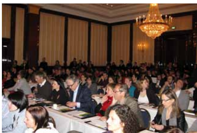
Sala konferencyjna była wypełniona po brzegi

Z Programu MEDIA przez 20 lat skorzystało ponad 20 tysięcy beneficjentów.