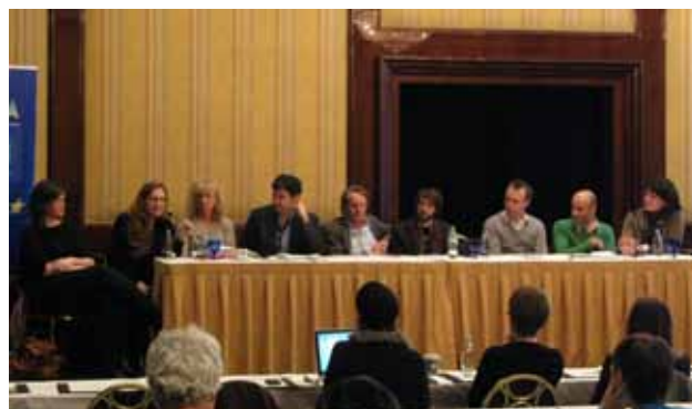
Prezentacja nowych programów szkoleniowych.

Ties That Bind pozwala dziesięciu doświadczonym producentom filmów fabularnych z Azji i Europy pracować razem nad ich projektami w ramach dwóch pięciodniowych sesji zorganizowanych w trakcie Far East Film Festival oraz w trakcie Pusan International Film Festival.