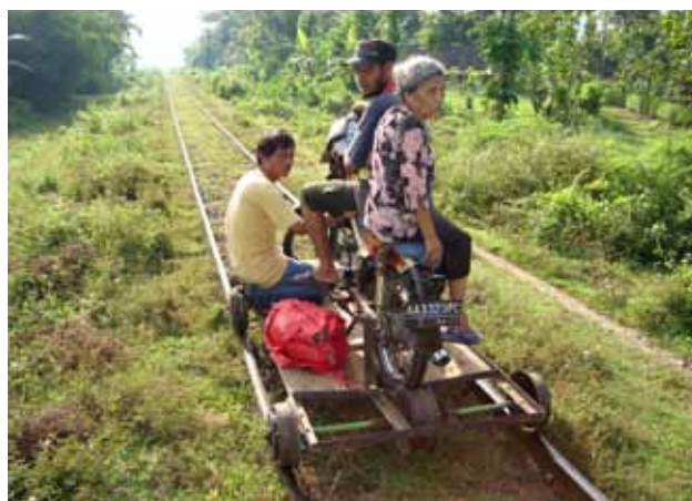
„Miejsce wśród gwiazd” (Position Among the stars) Leonard Retel Helmrich

Festiwal PLANETE DOC otrzymuje dofinansowanie Programu MEDIA.