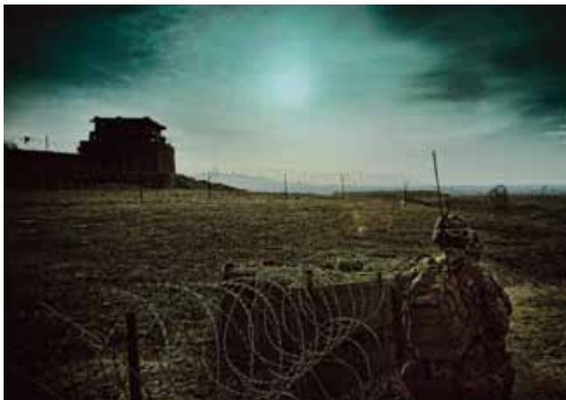
"Baza Armadillo" (Armadillo) Janus Metz