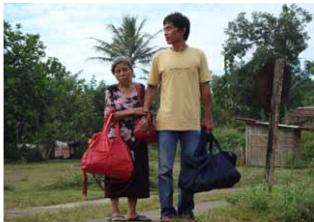
"Miejsce wśród gwiazd" (Position Among the stars) Leonard Retel Helmrich

Festiwal PLANETE DOC odbędzie się w dniach 6-15 maja w stołecznych Kinotece, Muranowie i Iluzjonie, a w dniach 6-8 maja w ramach „week-endu z cyfrowym PLANETE DOC” w kinach studyjnych w 20 miastach w Polsce. Pełna lista kin uczestniczących w projekcie będzie zamieszczona na www.planetedocff.pl