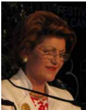
Komisarz Androulla Vassiliou