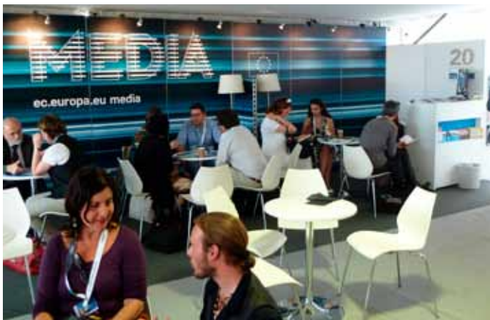
Stoisko MEDIA na Marche du Film 2011

Europejskie Obserwatorium Audiowizualne wspierane jest przez Komisję Europejską.