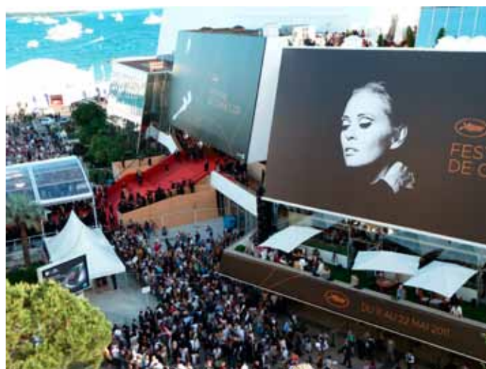
Festiwal filmowy Cannes 2011

ACE Producers ( ace-producers.com ) otrzymują dofinansowanie z program