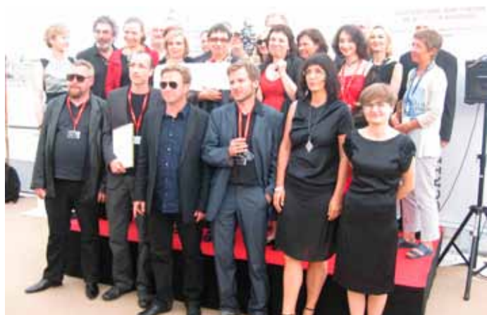
5. edycja ScripTeast