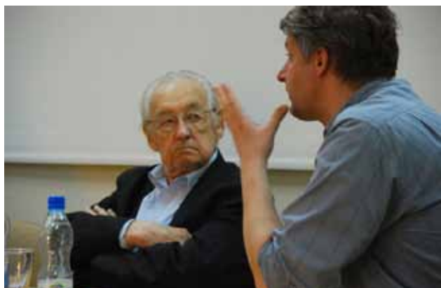
Ekran 2011 zajęcia z Andrzejem Wajdą