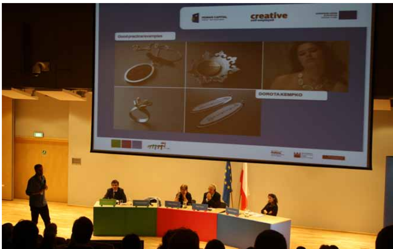
Konferencja Kompetencja w kulturze

Organizatorzy szacują, że w konferencji udział wzięło ponad 350 uczestników, w tym przedstawiciele rządu, instytucji kultury (m.in. archiwów, bibliotek, muzeów), organizacji pozarządowych, fundacji, stowarzyszeń, a także organizacji komercyjnych, pracownicy oświaty, technolodzy digitalizacji, przedsiębiorcy z sektora kinematograficznego oraz twórcy filmowi.