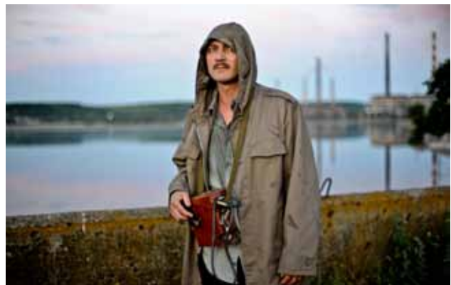
Andrzej Chyra „Znieważona ziemia”

kursowej sekcji International Film Critic's Week. Obraz opowiada historię kilku osób, których życie zniszczył wybuch reaktora w Czarnobylu. Pokazuje losy bohaterów w dwóch różnych okresach – w dniu eksplozji, a następnie dziesięć lat później. „Debiut najwyższej jakości” napisali organizatorzy w komentarzu do ogłoszonej selekcji. W główną rolę kobiecą wcieliła się Olga Kurylenko (dziewczyna Bonda z „Quantum of Solace”). Muzykę do filmu skomponował Leszek Możdżer.