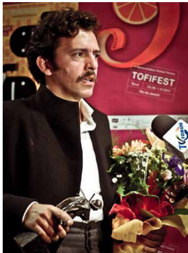
Piotr Głowacki. Aktor odbiera nagrodę Flisaka